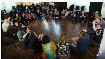
Capacitação de profissionais fortalece o Programa MusicaR. 1/3

Palmas, estalos de dedos e assobios, tudo é música para os professores e coordenadores do MusicaR, que nessa semana participaram da oficina de música corporal, na Capela Santa Maria. Foi o quarto encontro de aperfeiçoamento dos profissionais do programa de musicalização infantil nas Regionais, com o objetivo de traçar novas metas para as aulas do segundo semestre.