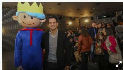
Evento em comemoração aos 100 anos do Hospital Pequeno Príncipe no Cine Passeio. Na imagem Eduardo Pimentel, Vice Prefeito de Curitiba participa do evento - Curitiba, 20/08/2019