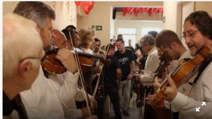
A Camerata Antiqua de Curitiba fará apresentações gratuitas nesta semana: o "Concerto nas Igrejas" e o "Música pela Vida".

A Camerata Antiqua de Curitiba fará apresentações gratuitas nesta semana: o Concerto nas Igrejas e o Música pela Vida. As apresentações serão nesta quinta-feira (15/8), às 10h30, no Hospital da Clínicas, e às 20h, no Santuário Diocesano Sagrado Coração de Jesus, no Água Verde.