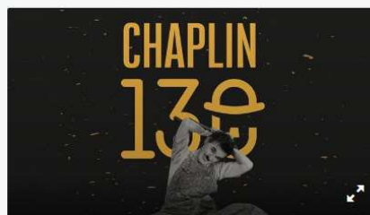
Cine Passeio recebe uma Mostra entre os dias 15 a 21 de agosto, com os melhores filmes de Charles Chaplin.