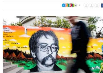
Photo: Paulo Leminski comemora 74 anos em 2019