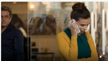
Cinco estreias, Sessão da Meia-Noite e filmes com protagonismo feminino movimentam o Cine Passeio. Na imagem, Cena do filme Não Mexa Com Ela.