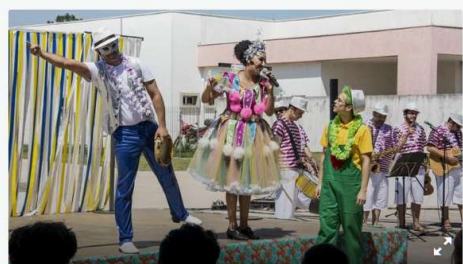
Aula de Iniciação ao Samba na Regional Tatuquara. Curitiba, 17/02/2020.

Música, alegria e um jeito divertido de aprender mais sobre o samba como expressão genuína da cultura brasileira. Este foi o clima na manhã desta segunda-feira (17/2), na Rua da Cidadania do Tatuquara.