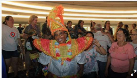
Baile de Carnaval vai animar idosos atendidos pela FAS.