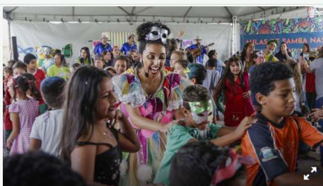
Coreto do Passeio Público e Ruas da Cidadania terão aulas de samba.

“Quem não gosta de samba bom sujeito não é”, já dizia Dorival Caymmi, e Curitiba vai mostrar que tem samba no pé com as apresentações programadas para acontecer entre os dias 8 a 21 de fevereiro, em diversos espaços. O espetáculo Iniciação ao Samba – Uma Viagem Através do Samba passará por todas as regionais e levará ao público a origem e história de um dos maiores símbolos da cultura brasileira, o samba.