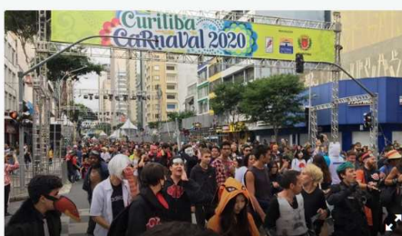
Foliões agitam o Carnaval Nerds na Avenida Marechal Deodoro na tarde de sábado (22) - Curitiba, 22/02/2020