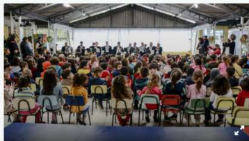
Crianças do CMEI Santa Efigênia convidaram os músicos da Banda Lyra para apresentação participativa de atividades sobre música clássica. Curitiba, 08/10/19.

A Banda Lyra de Curitiba, sempre presente em comemorações oficiais da Prefeitura, fez uma apresentação especial nesta terça-feira (8/10). Os músicos atenderam ao convite feito por curitibinhas do Centro Municipal de Educação Infantil (CMEI) Santa Efigênia, no Barreirinha, e foram até a unidade para um concerto didático com repertório variado, passando por músicas clássicas aos sucessos infantis.