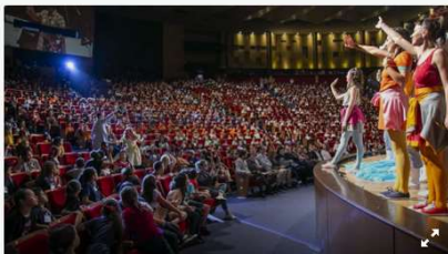
Apresentação do espetáculo "Villa-Lobos para Crianças – O concerto Mágico de Tuhú", no Teatro Positivo - Curitiba, 10/10/2019

As duas apresentações do espetáculo "Villa-Lobos para Crianças – O concerto Mágico de Tuhú", nesta quinta-feira (10/10), reuniram 5 mil crianças no Teatro Positivo. O prefeito Rafael Greca assistiu à apresentação da tarde, que também foi acompanhada por 2.400 estudantes da rede municipal de ensino de Curitiba.