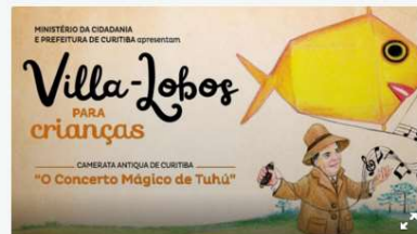
Na semana das crianças Villa-Lobos une dança e teatro ao som da Camerata Antiqua.

Para celebrar o Dia das Crianças, mais de 50 artistas da dança, música e teatro se unem no palco do Teatro Positivo, no dia 12 de outubro, para o concerto Villa-Lobos para Crianças.