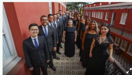
Na imagem Camerata Antiqua.