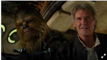
Star Wars 0 Despertando a Força.

Para comemorar o Dia das Crianças, neste sábado (12/10), o Cine Passeio, em parceria com o fã-clubê Conselho Jedi Paraná, programou sessões especiais de três filmes da saga Star Wars, com ingressos gratuitos. Um deles será exibido às 19h, ao ar livre, no terraço do Cine Passeio. Os outros dois serão exibidos na sessão da meia-noite, nas Salas Luz e Ritz.