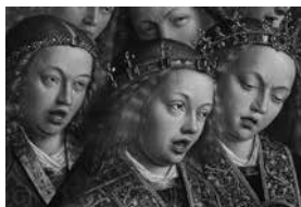
Jan van Eyck (1395-1441) The Ghent Altarpiece: Singing Angels