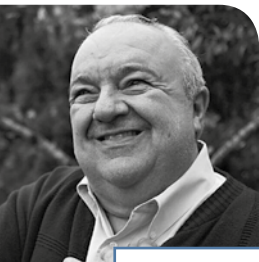
RAFAEL GRECA DE MACEDO Prefeito de Curitiba