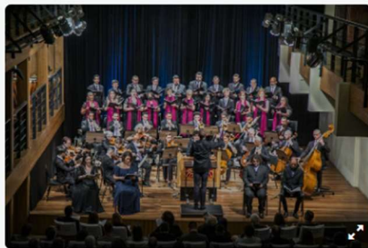
Camerata Antiqua celebra o Dia dos Finados com música sacra.