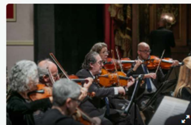
Pink Floyd, Metallica e Beatles ganham versão camerística da Orquestra da Camerata.

Led Zeppelin, Pink Floyd, Metallica, Nirvana, Guns N' Roses. Os riffs que moldaram a história do rock ganham novas formas nas cordas da Orquestra de Câmara de Curitiba, que apresenta o concerto Rock por Arcos sob regência e arranjos de Gustavo Petri (SP). As apresentações acontecem nesta sexta-feira (14/11) às 20h, e sábado (15/11), às 18h30, na Capela Santa Maria. Os ingressos estão quase esgotados e podem ser adquiridos pela plataforma ZET. Clique aqui .