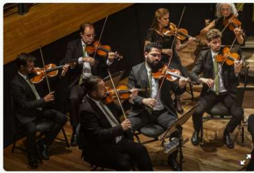
Orquestra de Câmara de Curitiba apresenta Festival Tchaikovsky com obras famosas do compositor russo.