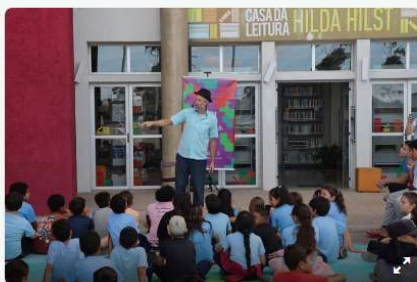
Maratona de Histórias no domingo reúne sete contadores na “nova” Casa da Leitura, perto do Barigui. 1/9

A programação do Curitiba Lê segue intensa ao longo do fim de semana, oferecendo ao público a oportunidade de mergulhar no universo literário em diversos pontos da cidade. Uma série de atividades ocupa as Casas da Leitura de Curitiba, com contações de histórias, encontros com autores e ações voltadas à formação de novos leitores.