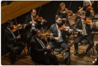
Orquestra de Câmara de Curitiba abre os Concertos nas Igrejas no Hugo Lange.

A Camerata Antiqua de Curitiba inicia no dia 12 de junho a temporada do programa Concertos nas Igrejas com uma apresentação gratuita da Orquestra de Câmara na Paróquia Sagrados Corações de Jesus e Maria, no bairro Hugo Lange. Outros dez concertos estão programados para este ano, em uma iniciativa da Prefeitura de Curitiba para democratizar o acesso à música erudita por toda a cidade e aprofundar as relações com a comunidade.