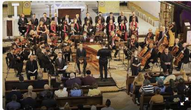
Camerata Antiqua fará ensaio aberto gratuito de concerto com compositores contemporâneos.