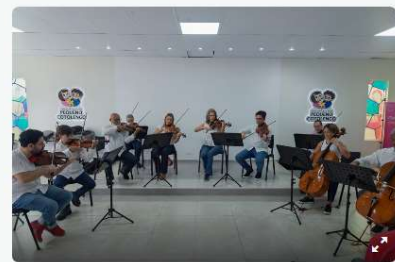
Apresentação da Orquestra da Camerata no Pequeno Cotolejo. Curitiba 29/03/25. 1/3

Texto: Franco Iacomini Prefeitura de Curitiba