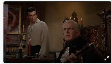
Cinemateca de Curitiba exhibe filmes de terror baseados em contos de Edgar Allan Poe. - Na imagem, O Solar Maldito (1960).

Depois de William Shakespeare, a Cinemateca de Curitiba continua com a programação de maio dentro do universo literário. Desta vez, serão exibidos filmes de terror baseados em contos do escritor Edgar Allan Poe e adaptados para o cinema.