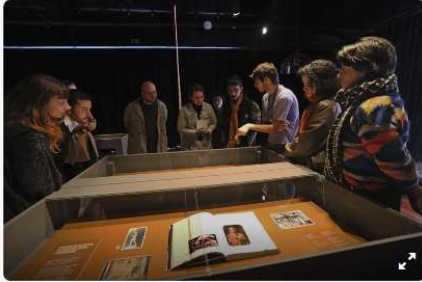
Exposição revela cartas raras de João Turin durante temporada artística em Paris. Curitiba, 12/05/2026.

A exposição As Correspondências Perdidas de João Turin foi aberta ao público nesta terça-feira (12/5), no Memorial Paranista do Parque São Lourenço, onde também estão expostas esculturas do artista. Com entrada gratuita, a mostra apresenta cartas, documentos e fotografias da fase em que o escultor paranaense viveu em Paris, entre 1914 e 1922.