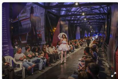
Boqueirão Fashion 2026 celebra 10 anos com edição ampliada em Curitiba.

Começaram os preparativos para o maior evento público de moda do país, o Boqueirão Fashion 2026. Com o tema "10 anos de histórias que vestem o tempo", o evento será realizado no período de 27 a 31 de julho, incluindo os tradicionais desfiles de moda, na passarela da Rua da Cidadania do Boqueirão.