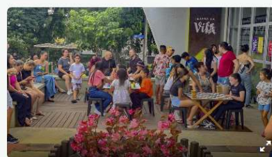
Teatro da Vila tem brincadeiras, filme e pipoca de graça neste sábado.

Brincadeiras, cinema, pipoca, apresentação teatral. Neste sábado (25/4), o Teatro da Vila, na Cidade Industrial de Curitiba, tem programação gratuita para toda a família.