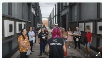
Memorial Paranista terá novos cursos e visitas noturnas em maio.

Em maio, que tal aprender modelagem em argila, criar objetos em madeira ou iniciar uma exploração em profundidade sobre a história da arte no Paraná? Esses são alguns dos temas de cursos, workshops, visitas guiadas e oficinas ofertados em maio no Memorial Paranista, que completa cinco anos. Boa parte das atividades é gratuita.