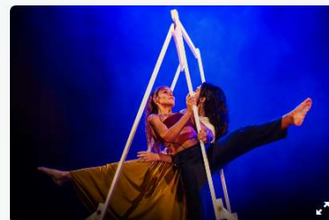
Cia Lápis de Seda desembarca em Curitiba com Desapego e oficinas na Casa Hoffmann.

Após o sucesso em Florianópolis (SC), com o Teatro Álvaro de Carvalho lotado, a Cia Lápis de Seda está em Curitiba para a etapa final do turnê do espetáculo Desapego. Até sábado (16/5), a companhia apresenta o espetáculo e promove oficinas práticas de dança na Casa Hoffmann, no Largo da Ordem.