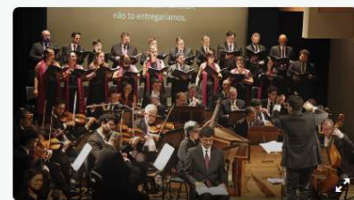
Entre Gestos e Sons, a Camerata Antiqua de Curitiba volta ao palco da Capela Santa Maria. Foto Cido Marques, 1/3

A Camerata Antiqua de Curitiba volta aos palcos na sexta (15/5) e sábado (16/5) com um programa que mescla despedidas e estreias, Américas e Europa, fé e angústia, comunidade e migração, música e silêncio. Intitulado Entre Gestos e Sons, o concerto trará peças de Ludwig van Beethoven, Camargo Guarnieri, Caroline Shaw e Andras Ellendensen, unidas por um desassossego em comum: a busca de significado diante do que escapa à linguagem.