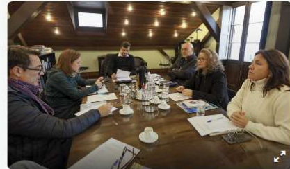
Presidente da FCC e equipe da Literatura tratam da programação do 4º Festival da Palavra de Curitiba

O 4º Festival da Palavra de Curitiba já tem data confirmada. O evento literário promovido pela Fundação Cultural de Curitiba para celebrar a palavra e suas múltiplas interseções será realizado de 5 a 9 de agosto.