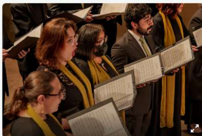
Coro da Camerata e grupos convidados apresentam Carmina Burana. 1/5

Uma das obras corais mais importantes do século 20, a célebre cantata Carmina Burana, de Carl Orff (1895-1982), será levada ao palco da Capela Santa Maria Espaço Cultural neste fim de semana em três apresentações gratuitas: sexta (24/4), às 20h, e sábado e domingo (25 e 26/4), às 18h30. Os ingressos poderão ser retirados na bilheteria do teatro uma hora antes de cada espetáculo.