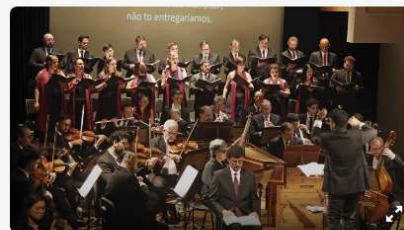
Entre Gestos e Sons, a Camerata Antiqua de Curitiba volta ao palco da Capela Santa Maria.