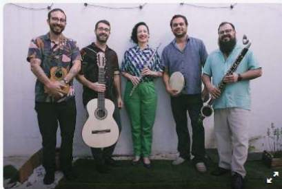
Choro Cruzado leva clássicos do gênero ao palco do Paiol. - Na imagem, grupo Choro Cruzado.