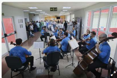
Programa Música pela Vida, no Hospital do Idoso Zilda Arns. Curitiba 28/04/26. 1/24