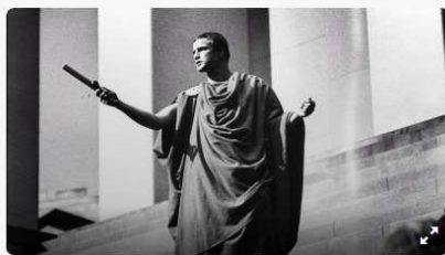
Cinemateca de Curitiba exhibe adaptações cinematográficas de Shakespeare. - Na imagem, Julio César (1953).

A mostra que começa nesta quinta-feira (7/5) na Cinemateca de Curitiba levará o público em uma viagem no tempo, até o século 16. Cinco filmes baseados em peças e textos do dramaturgo inglês William Shakespeare serão exibidos durante quatro dias seguidos. A entrada é grátis.