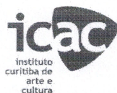
TABELA I DOS VALORES DOS ESPAÇOS PARA FINS CULTURAIS